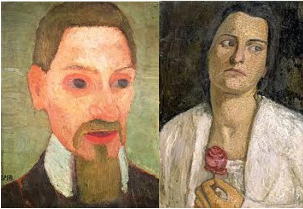
gemalt von der Freundin Paula Modersohn-Becker