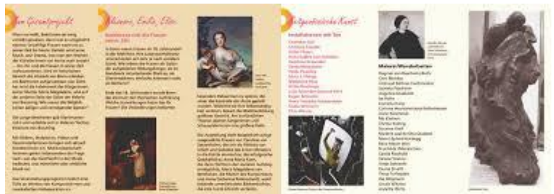
Ausstellung im Frauenmuseum Bonn zu Musikerinnen in Bezug zu Beethoven