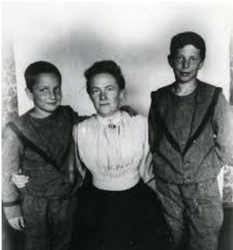
Clara Zetkin mit ihren Söhnen

Ausstellungsgespräch über Frauen in Afrika s. Seite 2 unten